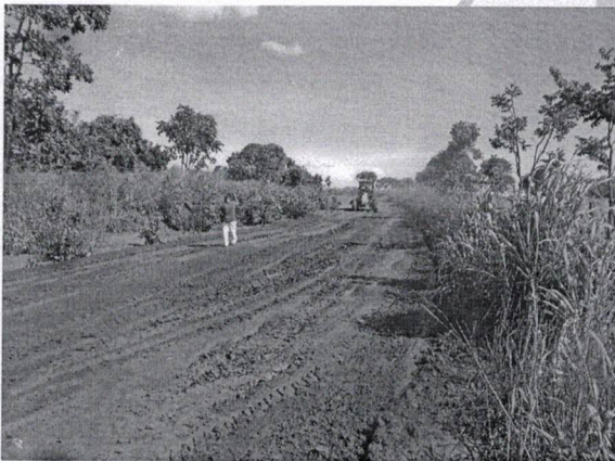
Foto 03 - Restauração da Estrada São Lourenço