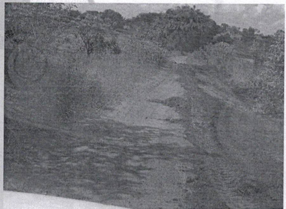
Foto 04 - Restauração da Estrada São Lourenço