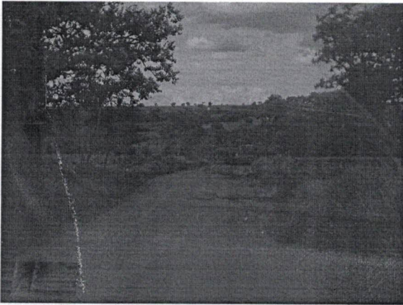
Foto 01 - Restauração da Estrada São Lourenço

CNPJ: 23.091.770/0001-92 – Inscrição Estadual: Isento