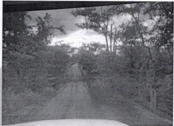
Foto 02 - Restauração da Estrada São Lourenço