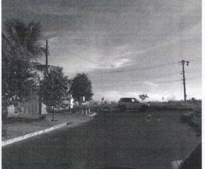
Foto 3 - Vista da Rua José Maria de Castro até Av Dr Omar Diniz