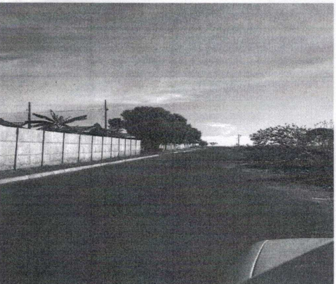
Foto 4 - Rua José Maria de Castro