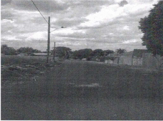
Foto 1 - Vista Poste com IP na Esquina da Ernesto Andrade com Marinho Dias - Implantação de IP's Intermediárias