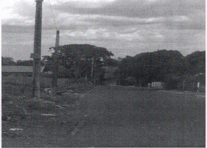
Foto 2 - Vista Ernesto Andrade - Trecho onde falta Postes intermediários com IP