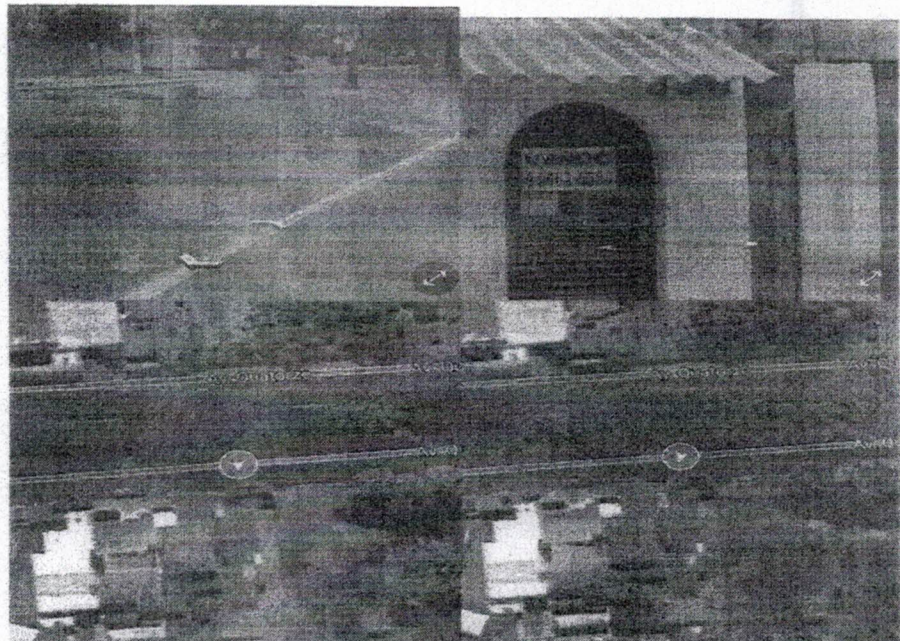
Sala das Sessões, em 20 de junho de 2022.

A indicação se faz necessária uma vez que o número de pedestres que passa por aquela via é muito grande, conforme verificado nas fotos anexas. E a construção desta travessia trará maior segurança para os moradores e usuários que atravessam ali todos dias.